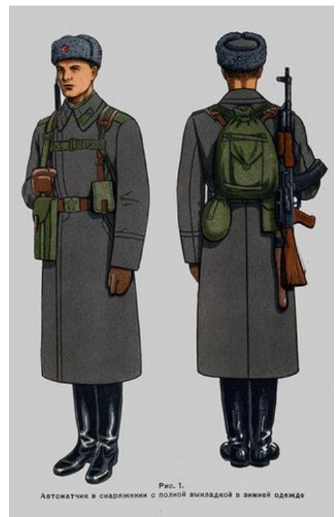
Рис. 1. Автоматчик в сивренежи с полной выкладкой в зимней одежде