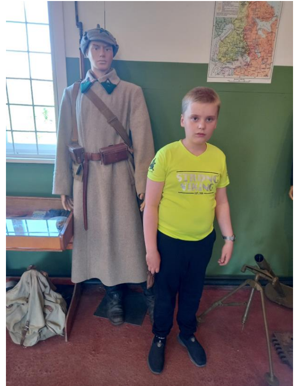
Военно-исторический музей «Четыре фронта» имени А. Бондарева, г. Сортавала