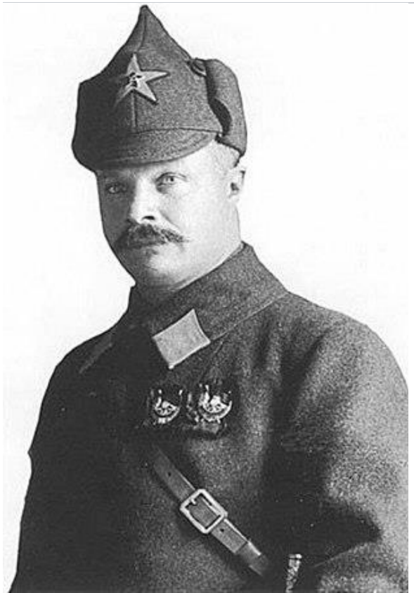
М. В. Фрунзе в зимнем шлеме («будёновке») и шинели