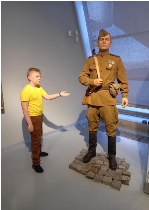
Белорусский государственный музей истории ВОВ