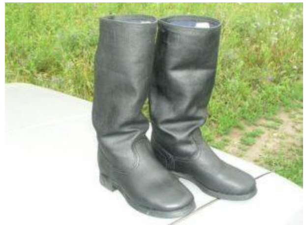
Сапоги из кирзы